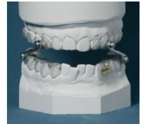
BußLa-Schiene in der Anwendung